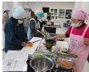
炊き込みご飯づくり