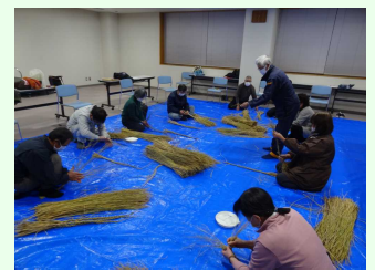
真剣に縄をなう参加者