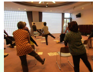
お尻とももの筋力アップ