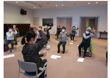
音楽に合わせてリズム良く

イスに座ってのストレッチや、頭を使うグーパー体操、筋肉を鍛えバランス力を向上させる片足立ちや足振り体操などのトレーニングをしました。また、音楽に合わせたリズム体操も行い、参加者は楽しく体を動かし、心地よい汗を流しました。