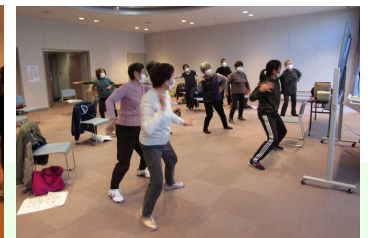
音楽によって全身運動