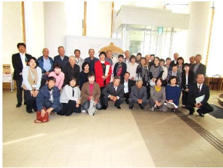
研修に参加した皆さん(湯沢市役所にて)

令和元年度自治会長等視察研修を10月17日(木)に、湯沢市の「若者や女性が輝くまちづくり推進協議会」を視察し研修を行いました。