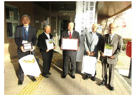
推進大会で受賞した皆さん （室蓬ホール前にて）