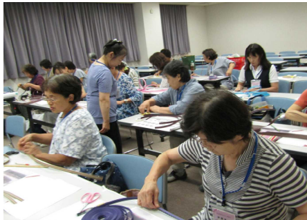
講師に聞きながら作業する参加者

教室は全5回コースで、5週連続で開催します。初回は、クラフトテープを切り分け、基本となるあじろ編みで土台作りをしました。2回目・3回目で本体から縁まで仕上げ、4回目に取り手を付け、5回目に内布を貼り完成する予定です。参加者は、好みのバッグのデザインや差し色を