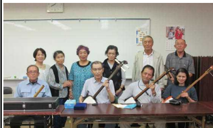
藤沢民謡保存会メンバー

しています。会員募集中ですので、興味のある方はぜひいらしてください。お待ちしております。