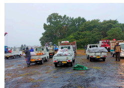
雨天でも実施します