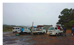
雨に濡れるので紙類は次回と判断した自治会も