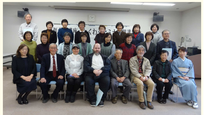
参加者全員で記念撮影（撮影時にマスクを外しています）