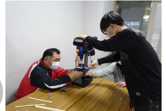
講師の先生と機械を微調整