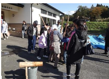
子どもたちと一緒に餅つき

10月19日は本郷白藤交流館を会場に第11集落のみなさんが9月に刈り取りした餅米で、子どもたちと地区住民と一緒に餅つきを行いました。