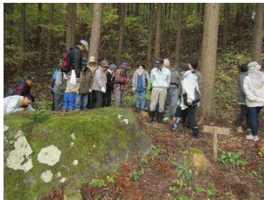
左：大蛇石の説明を受ける参加者