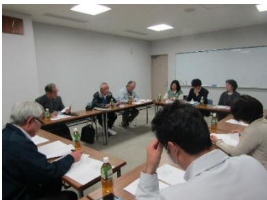
食改藤沢支部長たちを招いての話し合い

10月26日に藤沢町住民自治協議会第4回教育民生部会を開きました。部会では、高齢者支援や見守りについて検討しています。