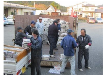
黄海分館で積み込み作業