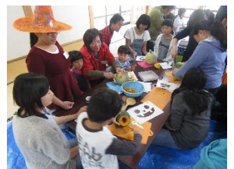
ALTとランタンづくり

10月10日大籠の郷土文化保存伝習館を会場に「ハロウィンランタンづくり」が開催されました。この事業は、藤沢市民センターと大籠キリシタン史跡保存会、大籠地区自治会協議会の協働提案事業の一環として開催されました。当日は地元小中高生をはじめ父兄や地域のみなさん50名ほどが集まり、かぼちゃを切り抜きランタンづくりをしました。また、英語翻訳の際にお手伝いを頂いた英語講師 ALT のみなさんも参加し、和やかな雰囲気が進みました。作った「ランタン」は参加者が自宅に持ち帰り楽しんでいることでしょう。