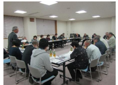
第6回住民自治協議会理事会の様子