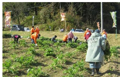
大根を袋一杯に詰めます！

10月28日、増沢の「畑沢やさい村」では、最初の新沼保育園の子どもたちも参加して「大根狩り」が行われました。