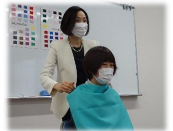
カラーコーディネートを実演

参加者からは、「大変よかった」「自分に似合う色がわかった」「今後の参考にしたい」などの感想が寄せられました。