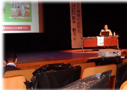
自治会長等研修の様子 : 写真