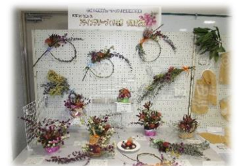
文化祭で作品展示展示

ビューティフル整備事業では、次年度の花苗の種類を検討しながら、今後もこの研修を実施したいと考えています。