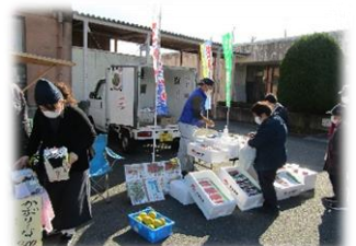
軽トラ市の様子 : 右

主催した協議会の役員の方は、「大勢の人に来て頂き、有り難い。今後も続けていきたい」と話していました。