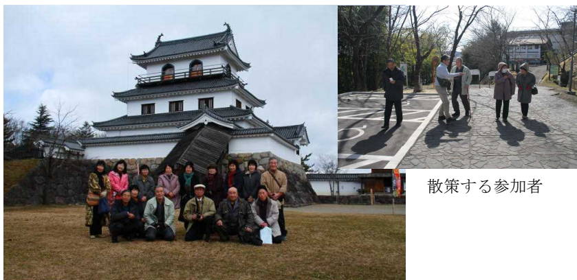
白石城の前で記念撮影

なお、春季吟行会は日程が決まり次第告知放送でお知らせしますので、皆さんの参加をお願いします。