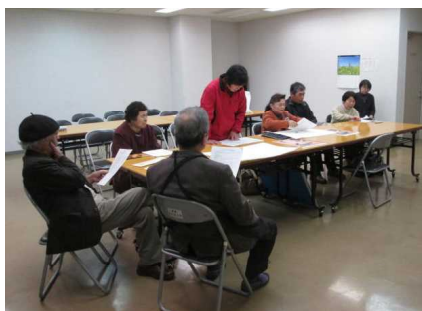
自己紹介をする絵画コースの受講生