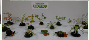
上：かごバッグ 下：こけ玉