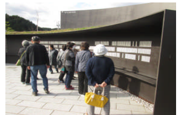
祈りのパークで足を止める参加者

好天に恵まれ、町内から参加した18人は、震災から10年目を迎える釜石市を訪れ、釜石大観音やシープラザ釜石、釜石祈りのパークなどを巡り、復興の進む町並みや海を眺めたり、買い物を楽しんだりしました。