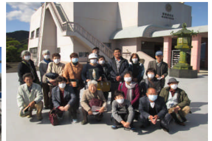
マスクの下はみんなにっこり