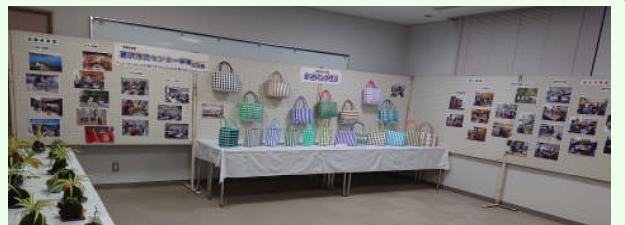
事業写真・作品展