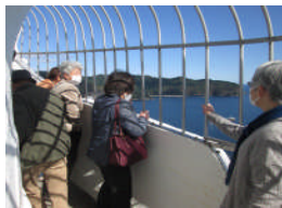
釜石大観音から海を望む