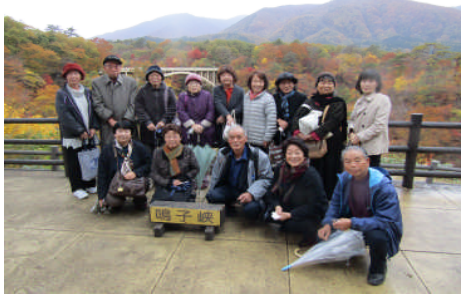
鳴子峡で記念撮影

小雨の降るあいにくの天気となりましたが、町内外から参加した15人は、木々が鮮やかに色付いた鳴子峡や中山平温泉周辺