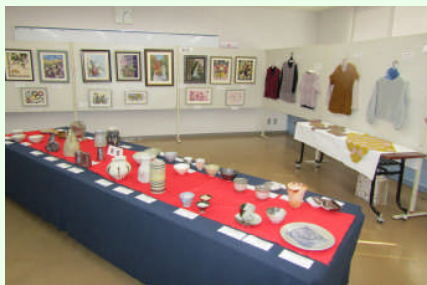
陶芸・押し花・編み物コース