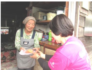
「がんづき」を届ける食改さん

「ふれあい一皿運動」は、食生活改善推進員が中心となり、各自治会や地区協議会、民生委員さん方の協力を得て、月1回郷土食を手作りして届ける活動を行っています。