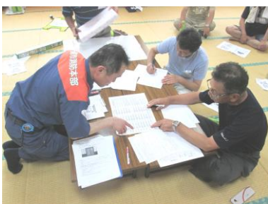
消防署員に指導を受ける参加者

黄海地区住民自治協議会では、7月28日（日）に藤沢市民センター黄海分館を会場に「避難所運営研修会」を開催しました。