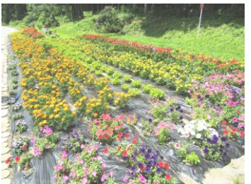
第8区自治会の花壇