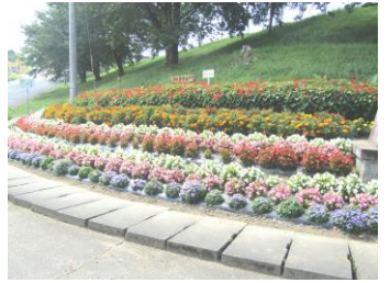
第3区自治会の花壇