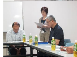
第4回理事会の様子