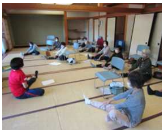
しっかりストレッチ

「つまずき防止体操教室」は10月18日、市内から11人が参加して藤沢市民センターで開催しました。