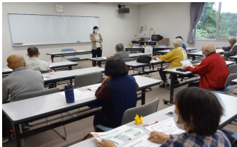
説明を聞きながら操作する参加者

また、説明書を見ながら、QRコードの読み取りにも挑戦し、一関市や平泉町のホームページも閲覧して楽しみました。