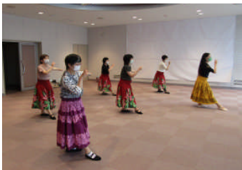
フラダンスの動きを学ぶ受講生

各講座は、途中からの加入も出来ますので、興味のある方は一関市藤沢市民センター（電話63-5515）までお問い合わせください。