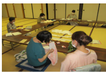
半襟の付け方を学ぶ着付けコース