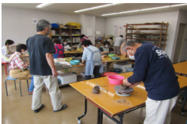
作品作りをする陶芸コース