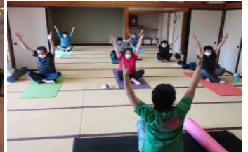
体を解すゆるぽか腸ヨガコース