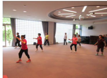
軽快に動くエアロビクスコース