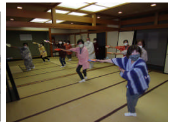
舞を習う舞踊コース