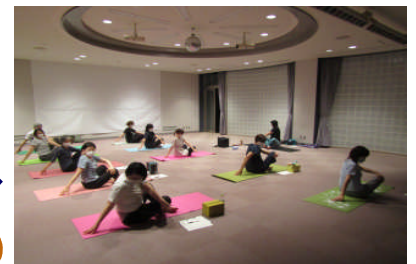
リラクゼーションヨガコース