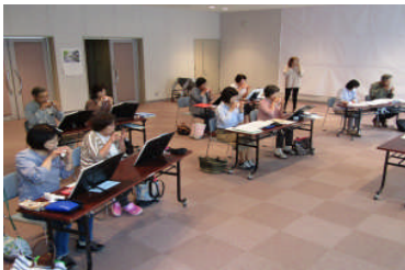
演奏するオカリナコース