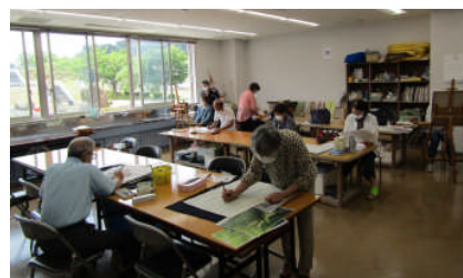
作品にとりかかる絵画コース