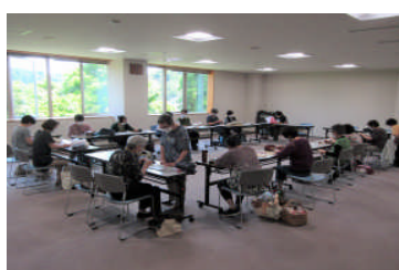
作品に挑戦する編み物コース