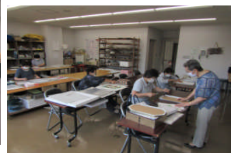
押し花・ホビークラフトコース