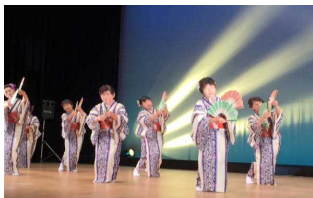
ステージ発表する受講生