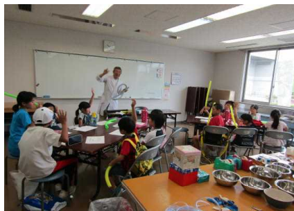
掃除機のホースを回すと音は出るかな？

夏休み出前科学実験教室は7月28日、町内の小学生13人が参加して藤沢市民センターで開催しました。