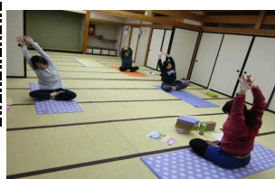
準備体操はしっかりと