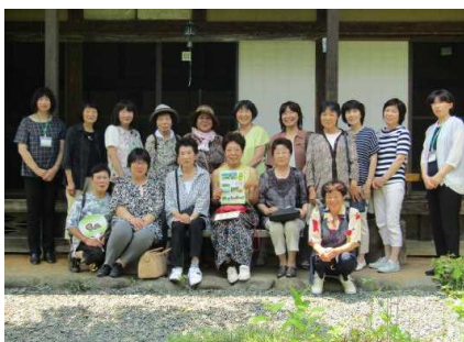
伊東家の座敷前で記念撮影

金ケ崎町の国選定城内諏訪小路重要伝統的建造物群保存地区にある伊藤家侍住宅（和洋食堂エクリュ）では、店主から藤沢町とのつながりや歴史・屋敷の説明を聴き、より身近に感じてきました。趣のあるお座敷でおいしい食事を食べ、庭や小路を歩いて、ゆったりとした時間を過ごしてきました。