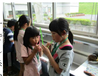
ストローで音出しに挑戦

また、バケツに黒ビニールを張って塩をのせ、声で塩の動く様子を観察しました。参加者は「糸電話の糸をバネにすると変な声になるのを初めて知った」「色々な実験があつて楽しかった。家でも実験してみたい」と話していました。