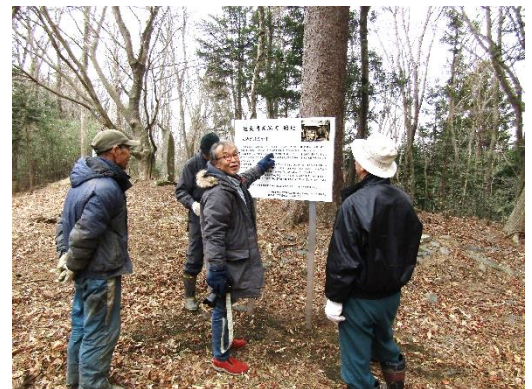
天神社跡に説明看板を設置

また、3月には青木求順が彫刻した「菅原道真公」の木製座像（現在長徳寺に安置）が安置されていた「保呂羽天神社」跡地に、求順と天神社との関わりを説明した看板を設置しました。この看板は地域住民に、求順の功績を後世にも伝えたいとの思いから設置されたものです。