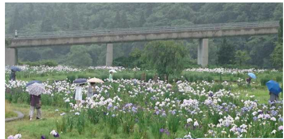
あやめ園を散策する参加者

わくわくセミナー文芸コース 夏季吟行会は7月7日、18人が参加し、岩手県和賀郡西和賀町の錦秋湖川尻総合公園あやめ園と碧祥寺博物館で開催しました。霧雨の中、色とりどりのあやめ120種12万本が咲くあやめ園を歩き、350年の歴史を持つ古刹碧祥寺に設けられた博物館ではマタギに関する資料や生活用具などを見ながら、詩歌づくりや写真撮影を行いました。参加した皆さんから寄せられた俳句、川柳、短歌、写真は後日ロビーに展示します。