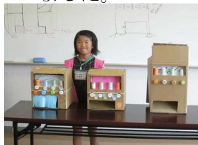
完成した作品に喜ぶ児童