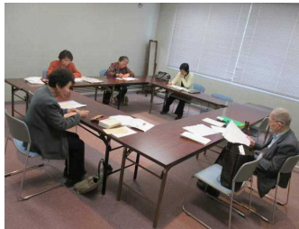
作品について話し合う受講者