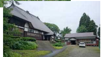
民俗資料が並ぶ博物館