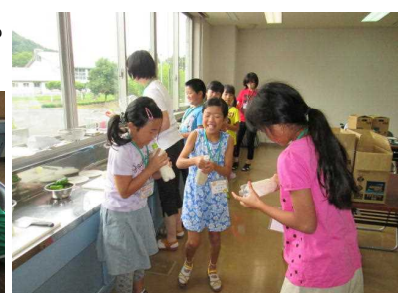
ペットボトルで生地作りをする児童