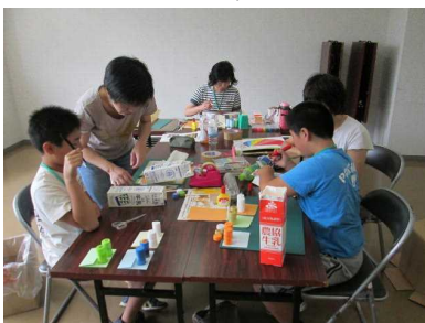
協力しながら作業を進める親子等

夏休み親子企画で、お母さんらとペットボトルのキャップをつなぎ合わせたり、ダンボール箱や牛乳パックを切り抜いたり協力しながら作りました。参加者は「案外難しかったけど、最後まで作れてうれしい」「また家でも作ってみたい」と完成した作品を手にして喜んでいました。