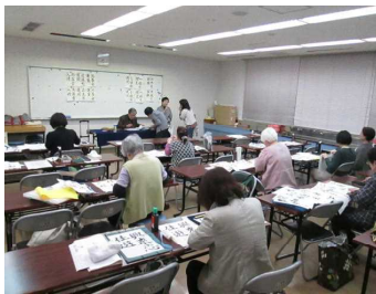
手本を元に筆を運ぶ受講者