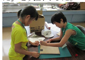
ピザ釜作りをする児童

ペットボトルにピザ生地材料を入れ良く振り、発酵させている間にダンボールでピザ釜を作りました。厚いダンボールをカットするのに苦戦しながらも完成させ、トッピングした生地を入れ焼き上げました。「ピザ釜を作るのが難しかったけど、ピザがきれいに焼けて良かった」と笑顔でした。