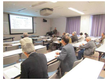
熱心にメモをとる受講者

参加者は「自分たちの地域の歴史を取り上げた内容で、説明もわかりやすくとっても良かった。勉強になりました」と好評でした。