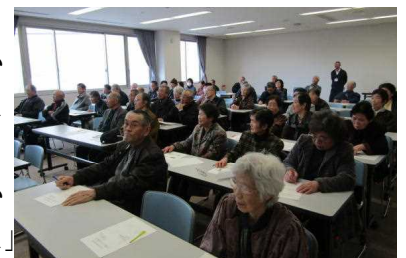
薬について学ぶ受講者