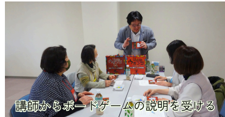
講師からボードゲームの説明を受ける

女性部長等研修を開催し「おらだのしゃべり場」で地域課題を語り合いました。まずはボードゲームで緊張をほぐす工夫を取り入れたことで、初対面でも本音が出しやすくなり、女性ならではの活発な交流の場となりました。