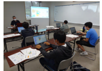
プログラミングに挑戦