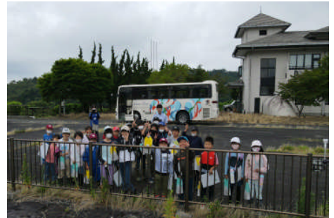
相川ダムを望み記念撮影