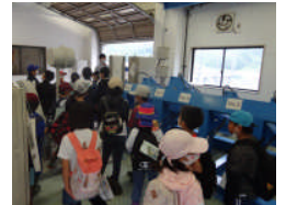
管理制御室を見学