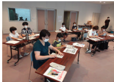
新聞紙でスリッパ作り

ッパや箱を作って楽しかったです」「災害では、まず自分の身を守ることが大事。防災についても一度家族で話し合いたい」と話していました。