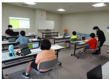
ミッションに挑戦

午後の部では、5・6年生が『コードモンキー』を使って、モンキーに命令を出し、ミッションをクリアする方法を学びました。参加者は「色々な