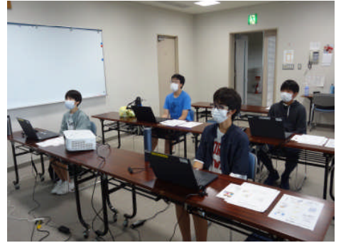
真剣に説明を聞く中学生