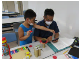
デザインはどれにする?

完成した銃を手にした子ども達は「切るのが大変だったけれど、的に当てゲームが楽しい」「お父さんと一緒に参加できてうれしい」と楽しんでいました。