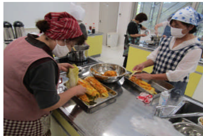
具材を葉の間にはさみこむ