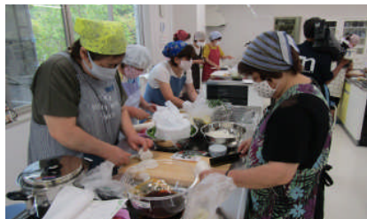
材料を切って下準備

夏にたくさん採れるきゅうりを無駄にせず、大きくなりすぎたものも使える佃煮と、これからの季節に採れる白菜を使って作るキムチ漬け。参加者は持ち寄ったきゅうりや大根を切って下ごしらえをして、調味料で煮詰めたり、白菜に挟み込んだりして完成させました。参加者は、途中で味見をして、完成したつけものに「難しいと思っていたつけものが簡単にできて良かった」と喜んでいました。