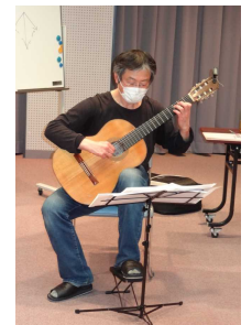
最後に演奏を披露