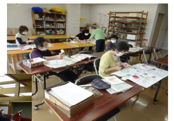
押し花・ホビークラフト