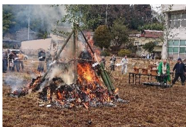
各地域で「どんと祭」が行われた。 上：徳田地区 右：保呂羽地区