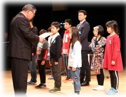
スポーツなどで優秀な成績で表彰(小学生)