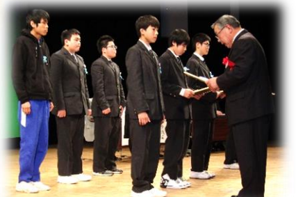
スポーツなどで優秀な成績で表彰(中学生)