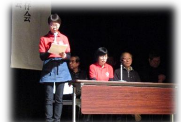
ななちゃんの会の発表