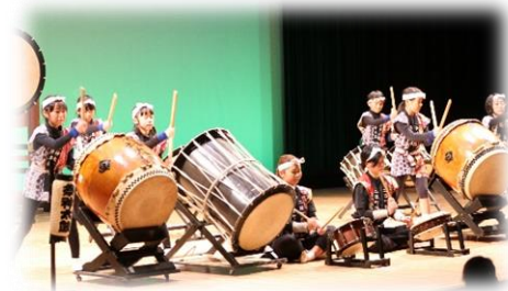
オープニングを飾る二日町祭神太鼓