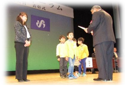
交通安全運動への取り組み(新沼保育園)