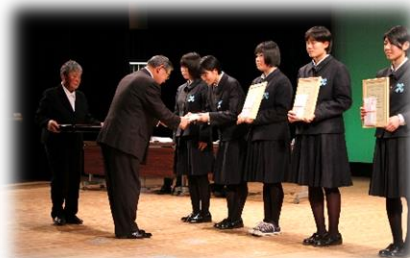
スポーツなどで優秀な成績で表彰(高校生)