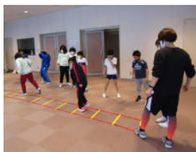
ラダーを使ってかけ足