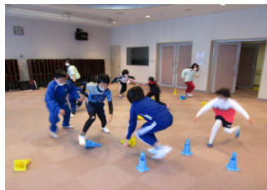
自分のチームのミニコーンを立てる

子どもたちは、2チームに分かれてミニコーンを使ったゲームや四つん這いで鬼ごっこ、ループやラダー（縄ばしご）を使った運動で、跳んだりはねたりして汗を流し、「(四つん這いでやる)へんてこおにごっこがむずかしかった」「みんなといろいろな運動ができて楽しかった」と喜んでいました。