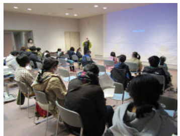
市民センター音楽ホールで事前学習

また、木星や土星を天体望遠鏡や双眼鏡で見たり、はくちょう座や天の川などをさがしたりしました。参加者は「星をたくさん見れてうれしい」「流れ星を見つけたよ」と喜んでいました。