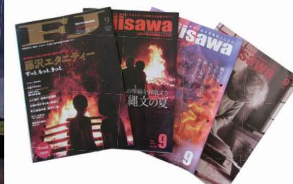
「広報ふじさわ」毎年9月号は野焼祭特集

この祭りの中心で燃え盛る「縄文の炎」は古里の再生を願う人々の熱い想いを象徴しています。