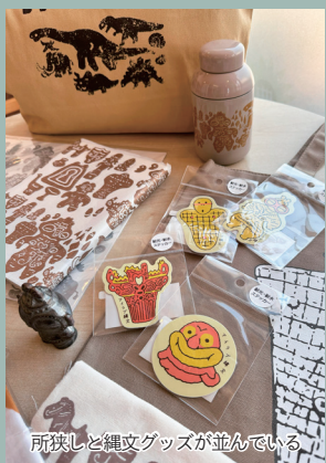
所狭しと縄文グッズが並んでいる