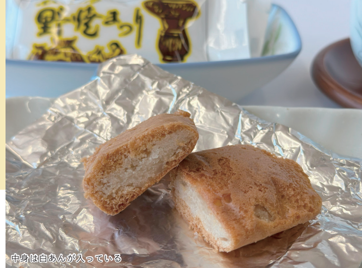
中身は白あんが入っている