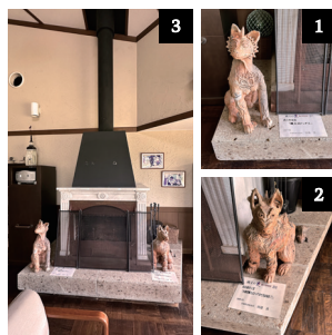
館ヶ森高原ホテルにて 1 縄文野焼賞 2 池田満寿夫賞 3 暖炉の前に鎮座している

今回のチャークラスでは、祭りを未来へ繋げるために協働で奮闘する「祭りの立役者」たちに迫ります。