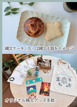
縄文ケーキ(左)は縄文土器をイメージ

自家製パンや焼き菓子、そして所狭しと並ぶ陶器や雑貨が訪れるたびに私たちをワクワクさせてくれる「いたう屋」。その中でも、ひととき目を引くのが「縄