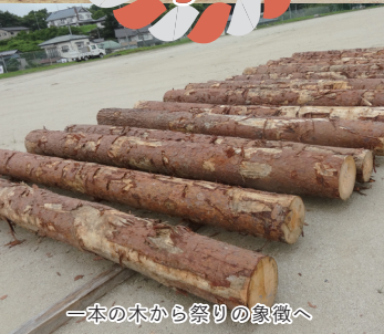
一本の木から祭りの象徴へ