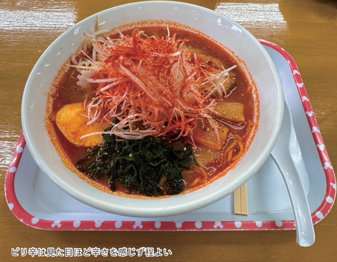
ピリ辛は見た目ほど辛さを感じず程よい