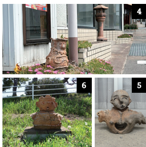
4 5 藤沢町商店街には軒先に作品が並ぶ 6 支所前には「縄文ミュージアム」として数点を展示