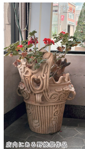
店内にある野焼祭作品

「藤沢のお土産」と聞いて、まず頭に浮かぶのが、青葉屋の銘菓「野焼まつり」ではないでしょうか。縄文土器が描かれたパッケージ、銀紙に包まれた、ほどよい甘さの生菓子は、どこか懐かしさを感じさせます。このお菓子が誕生したのは、約半世紀前。ちょうど野焼祭の歴史が始まる少し前のことでした。祭りの名に因んで付けられた「ふじさわ野焼まつり」は商標登録をしてから50年、当時の思いをそのままに、このお菓子もまた歴史を刻み続けています。