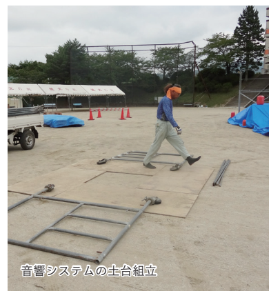
音響システムの土台組立