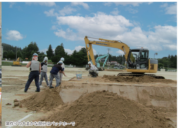
窯作りの大まかな部分はバックホーで

一夜限りの「縄文の聖地」 本格的な活動が始まる8月上旬。整えた土台を受け継ぐように、地元の各建設会社が現場へと入ります。ダンブやバックホーを操る精鋭たちの動きは、まさに阿吽の呼吸。流れるような連携で土を運び、実行委員会で練り上げた設計図を、寸分狂わぬ精密さで現実の「窯」へと築き上げていきます。 この窯の設計には、過去の失敗や試行錯誤から得た知見が凝縮されています。しかし、火を入れてから焼き上がりがどうなるかは、二日目を迎えるまで誰にも分かりません。この予測不能な「自然との対話」こそが、野焼祭の醍醐味でもあります。 会場中央にそびえるシンボル「縄文の炎」の組み上げは、まさに圧巻の一言。当日の「火入れの儀」から終わりまで轟々と燃え続けても決して崩れぬよう、職人はチェーンソーで丸太に溝を掘り、上下の重なりをミリ単位で調整し続けます。 匠の技に支えられた丸太は、祭りの終わりまで凍とした存在感を放ち続けます。組み上げが完了し、燃料となるバタ材が搬入されると、会場の熱気は一気に非日常の祭りムードへと押し上げられます。