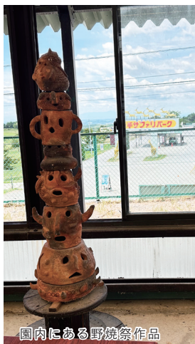
園内にある野焼祭作品

祭りのシンボル「縄文の炎」をいつでも感じられるようにと企画・開発されたのが「縄文の炎激辛味噌ラーメン」です。このラーメンは、岩手サファリパークの食堂で味わうことができます。辛さの奥にマイルドさがあり、食が進む一杯です。辛さは「ピリ辛」と「激辛」から選べます。また、園内には、野焼作品が展示されており、訪れるたびに野焼の熱気と雰囲気を感じられるようになっています。