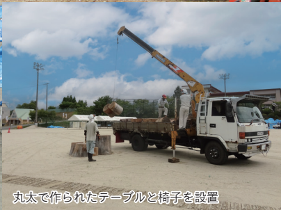
丸太で作られたテーブルと椅子を設置