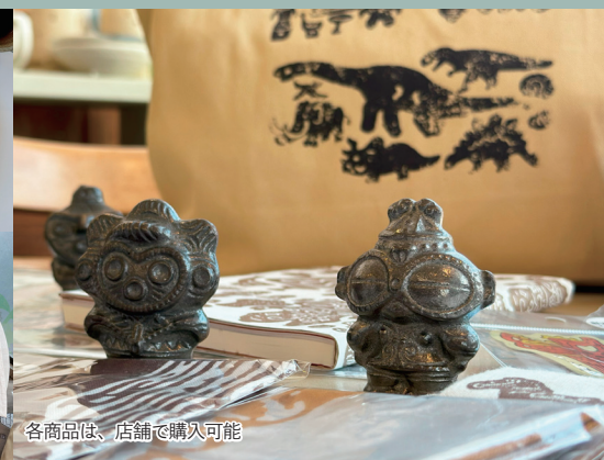
各商品は、店舗で購入可能