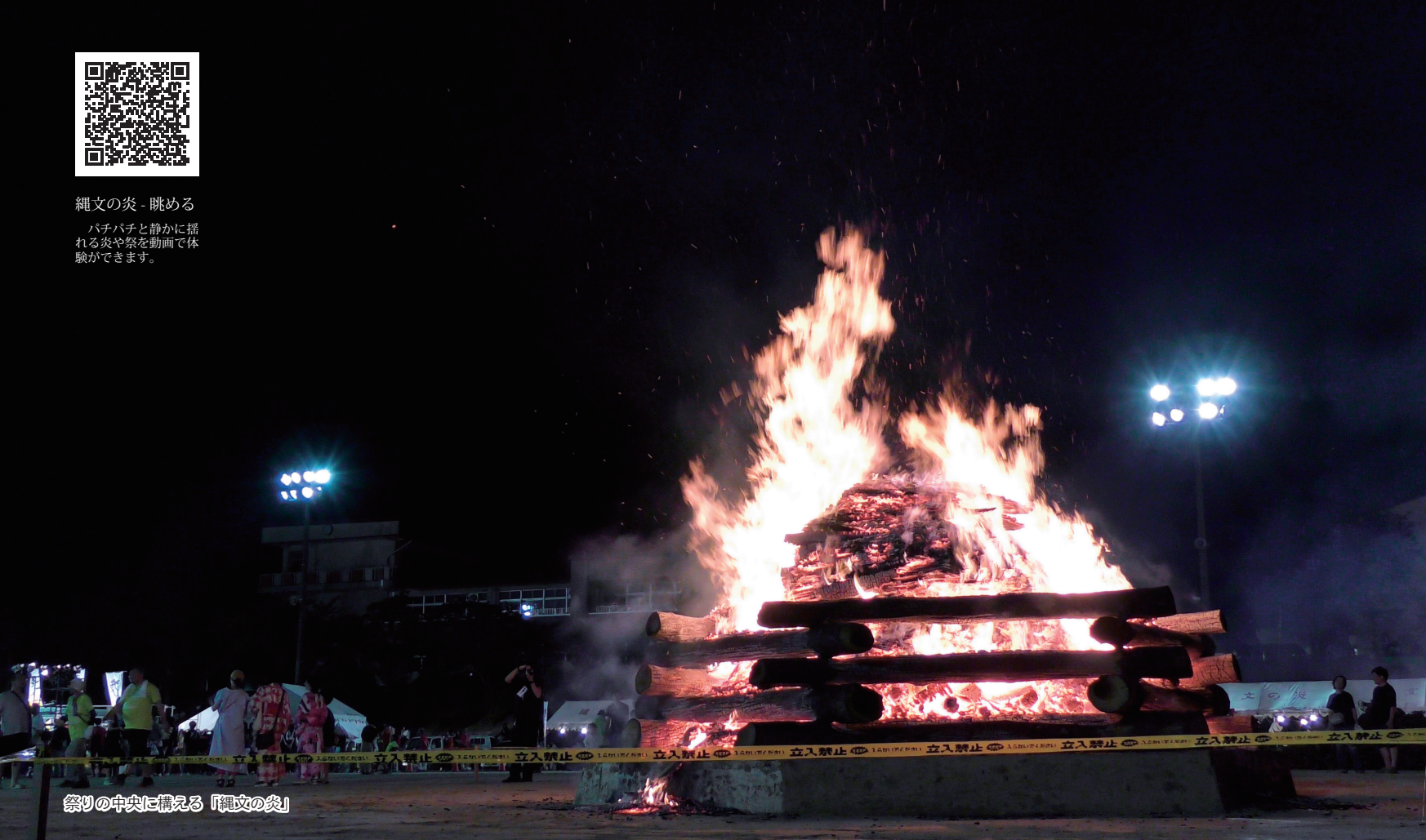
祭りの中央に構える「縄文の炎」