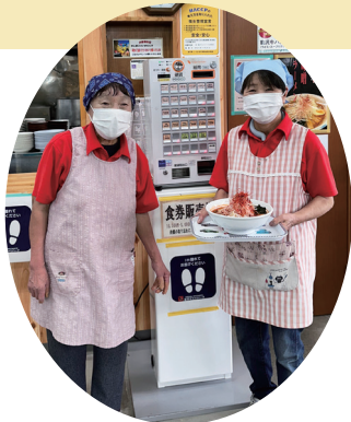
食堂・軽食コーナーで提供

祭りのシンボル「縄文の炎」をいつでも感じられるようにと企画・開発されたのが「縄文の炎激辛味噌ラーメン」です。このラーメンは、岩手サファリパークの食堂で味わうことができます。辛さの奥にマイルドさがあり、食が進む一杯です。辛さは「ピリ辛」と「激辛」から選べます。また、園内には、野焼作品が展示されており、訪れるたびに野焼の熱気と雰囲気を感じられるようになっています。