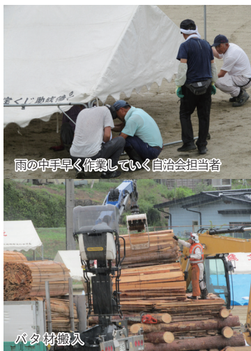
雨の中手早く作業していく自治会担当者