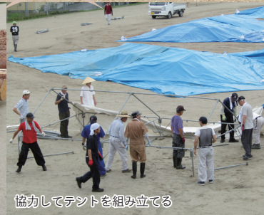
協力してテントを組み立てる