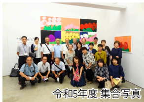
令和5年度 集合写真

空き校舎等への海外企業誘致について、地域の関わり方、接し方に対し先進地研修を行うものです。今年は、毎年1,000人以上の外国人旅行者に田舎体験プログラムなどを実践している山形県飯豊町へ研修に行きます。