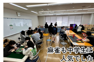
麻雀も中学生に 人気でした