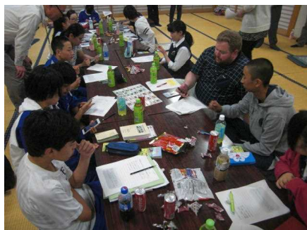
英訳作業に挑む中高生たち