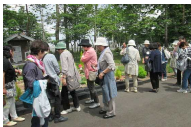
説明を聞く参加者